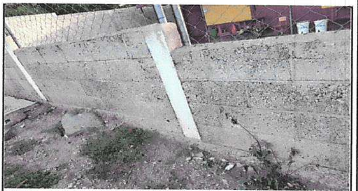
Sustitución de Lámina