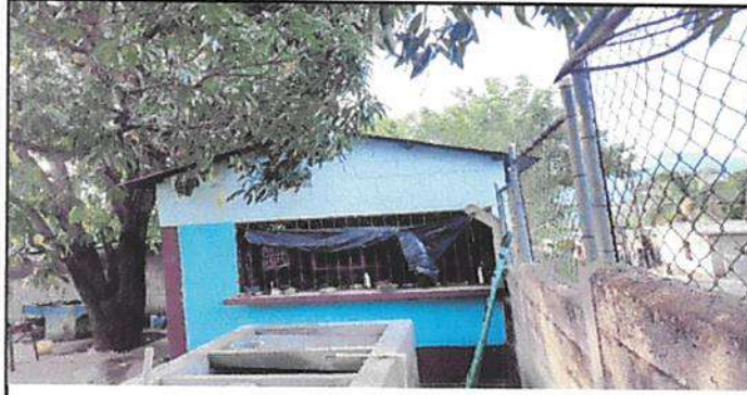
Contrucción de Galera para la pila.