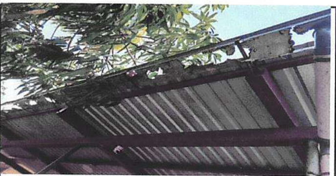
Sustitución de canal y bajadas para agua pluvial.