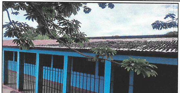
Instalación de Ventanas Pvc, pintura en muros interiores y exteriores.